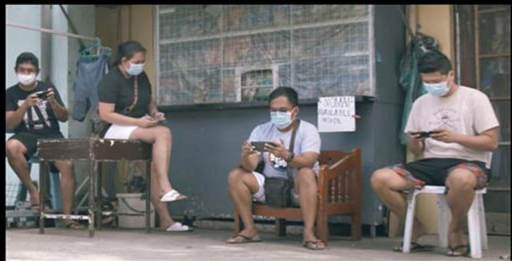
Cabanatuan City, Philippine